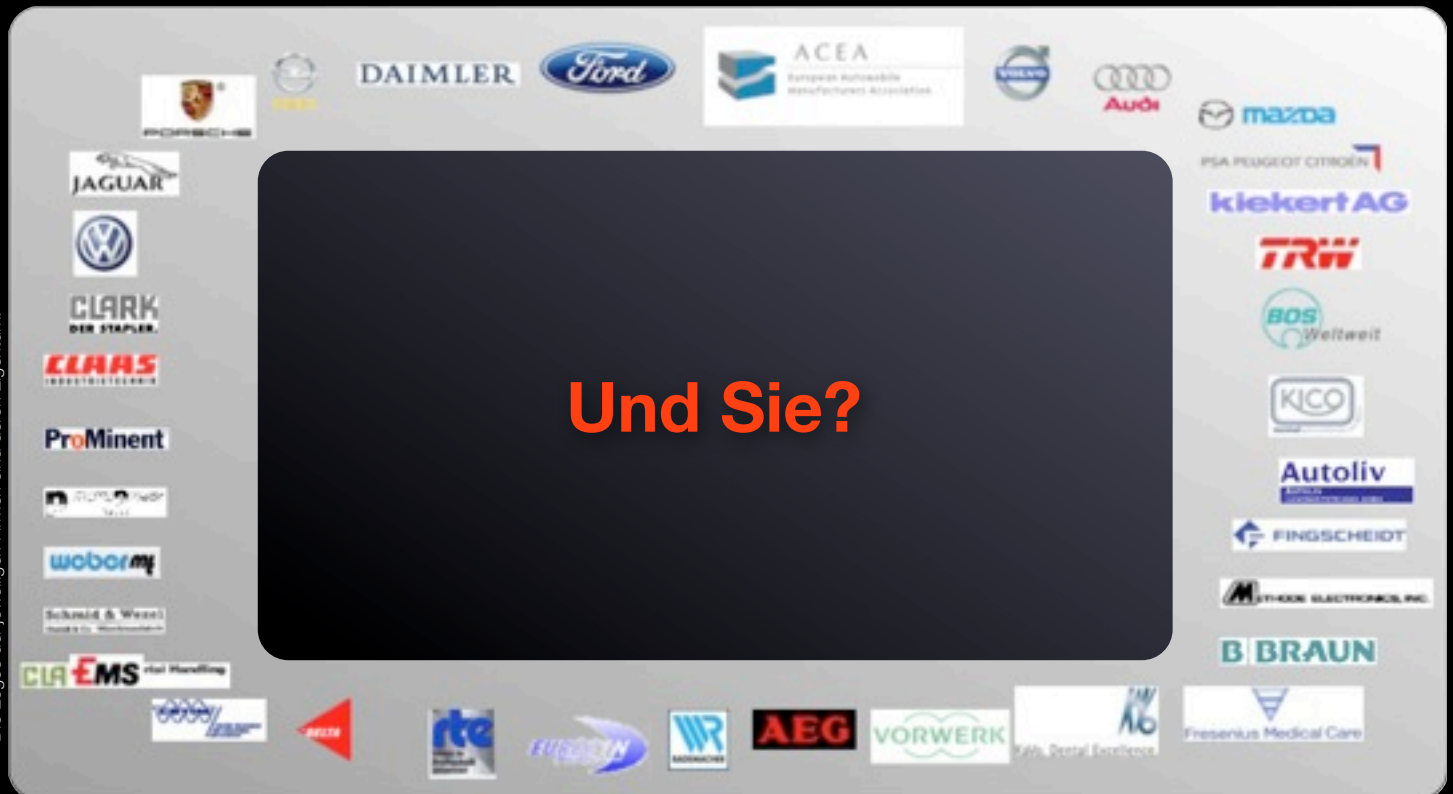
Die Logos der jeweiligen Firmen sind deren Eigentum.